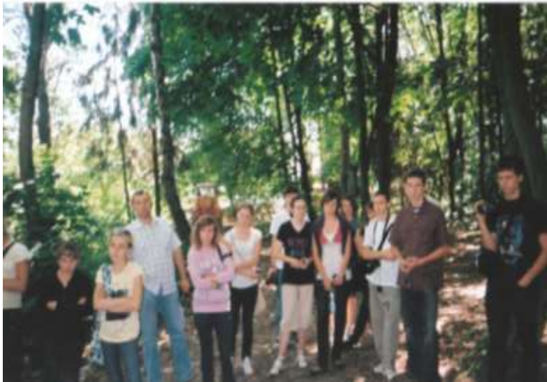
Młodzież szkoły Nr. 4 z Lublina, przy obelisku na kirkucie w Piaskach