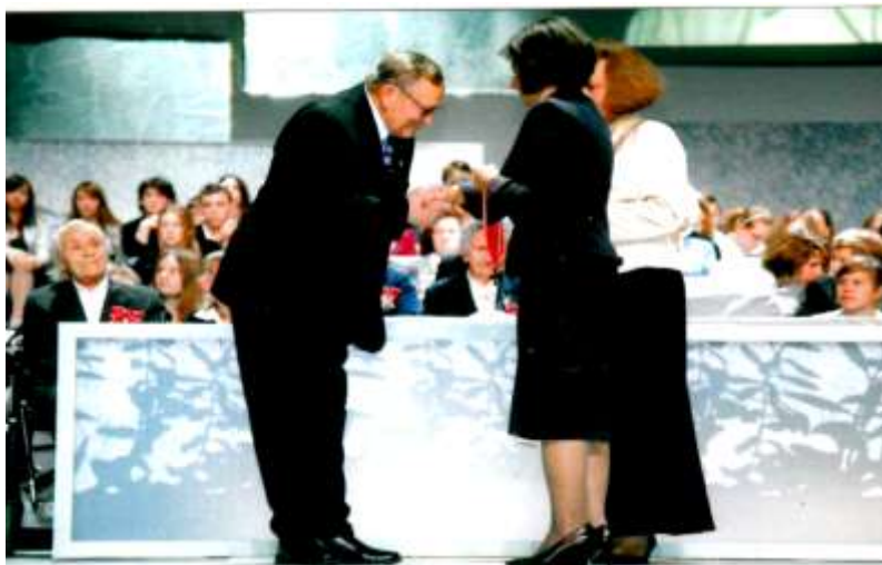
Maria Kaczyńska wręcza Maksymilianowi Jaroszowi Krzyż Komandorski Orderu Odrodzenia Polski, Warszawa 13 listopada 2008 roku