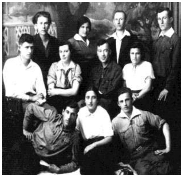
Członkowie gniazda Betaru w Piaskach– (skrót od Brit Josef Trumpeldor – Liga Józefa Trumpeldora), założona przez Związek Syjonistów Rewizjonistów, kierowana przez Włodzimierza (Zewa) Żabotyńskiego i Begina Menachema.