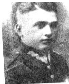
st. sierż. Kiszczak Kazimierz