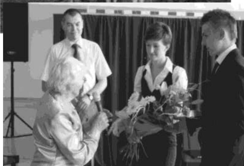
-Rzeczniów, dn. 08. 06. 2011