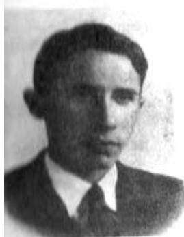
por. Kazimierz Puławski