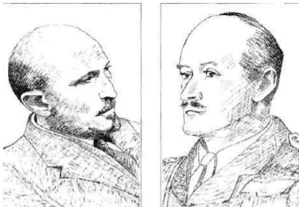
DR CHAIM WEIZMAN – GEN EDMUND ALWMBY